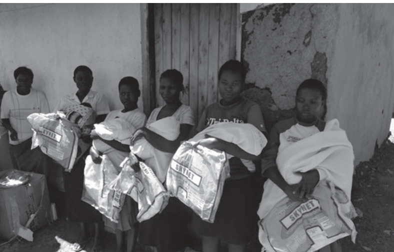
Verteilung von Moskitonetzen