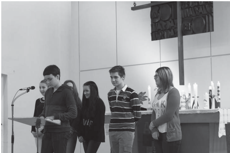
Konfis beim Taufenerinnerungs-Gottesdienst in Sölde

„Das war eine tolle Idee“, sagte die Mutter eines Täuflings und lobte die Konfirmanden für den tollen Gottesdienst und ihr Engagement für die Täuflinge.