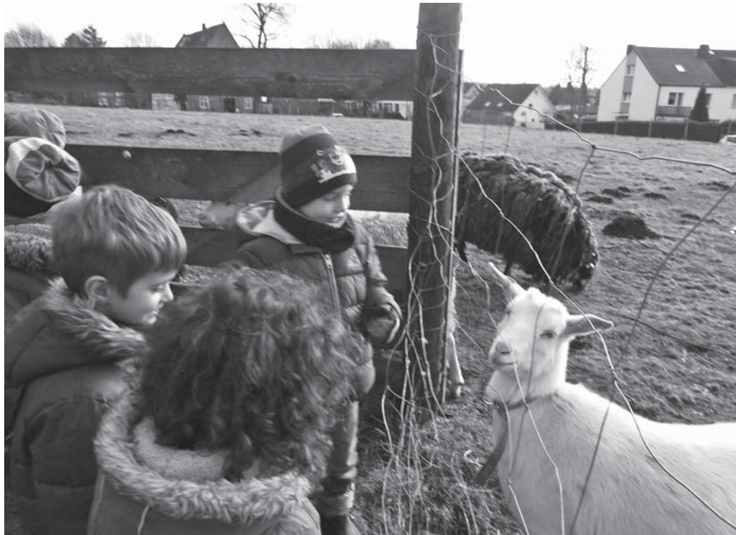
Wollproduktion in Sölde

intensiv erleben und den BiBFit Büchereiführerschein machen. Auch in der ersten Hilfe werden die Kinder im März vieles lernen und so zu Ersthelfern von Morgen. Theaterbesuch, Mosaikprojekt, Polizeipuppenbühne und Ausflüge in Dortmund sind ebenfalls noch geplant, bevor unser Maxis uns dann im Sommer verlassen.